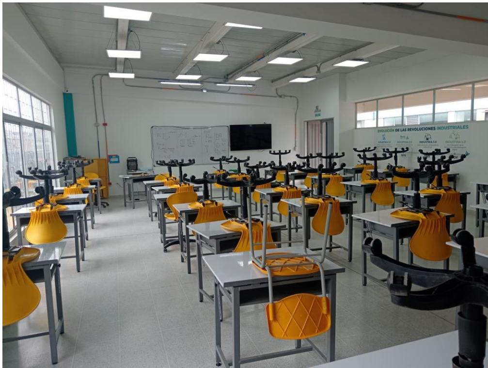
Fotografía No. 3 – Salón de clase (Dotado de escritorios, televisor y tablero).